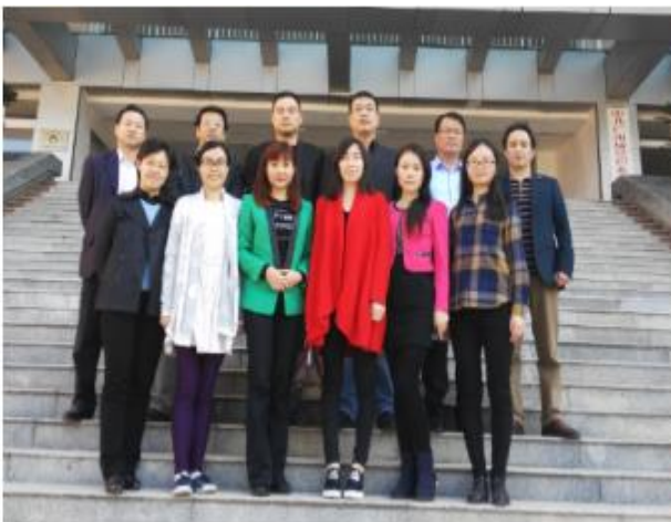
【省级优秀教学团队】

本专业主要培养学生具备“海陆空”国际货运代理业务以及报关报检等操作业务能力的发展型复合型创新型技术技能型专业人才。近年来连续四届学生参加广东省报关技能大赛均获佳绩。本专业拥有省级大学生校外实践基地和省级优秀教学团队，专任教师 12 人，硕士以上学历 11 人，在读博士 1 人，中高级职称以上 8 人，广东省优秀教师 1 名，校级名师 1 名，师德标兵 1 名，优秀教师多名。本专业的人才培养方案经校内外专家评审，荣获“优秀”等级。