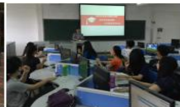
【企业兼职老师上课】