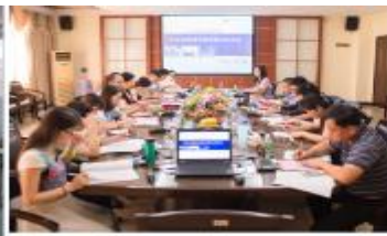
【校企共建专业指导委员会】