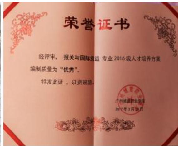
【优秀人才培养方案证书】