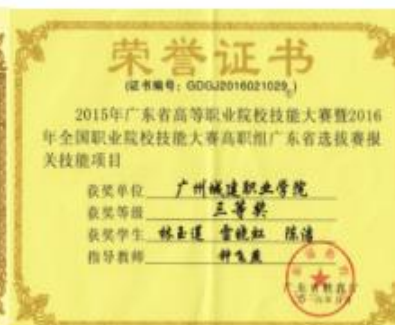
【广东省报关技能大赛获奖证书】