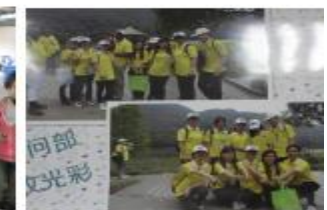
【学生参加外商活动】