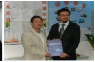
【校企共编实训教材】