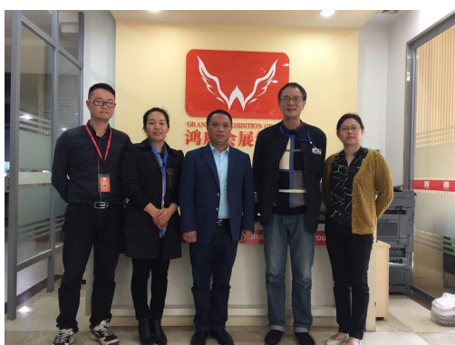
校企双方领导洽谈深度合作