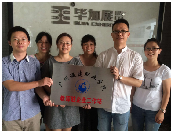
在广州毕加展览公司设立教师驻企工作站，提升教师实战能力

本专业拥有一支结构合理、专兼结合、富有活力的校级优秀专业教学团队。目前，专职教师 11 人，其中，高级职称教师 3 人，中级职称教师 8 人，国内外名牌大学硕士研究生 9 人，“双师型”教师 10 人，具有会展企业工作经历教师 3 人。另外，拥有 5 位来自工作一线实战经验丰富的兼职教师，均为广州知名会展公司经理或主管。本专业团队完成或在研省教育厅及其他省级教研教改项目 5 项，出版教材 4 部，在省级以上期刊杂志论文 20 多篇。