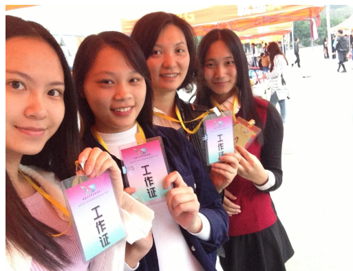
2015 第二届城建二手物品交易会