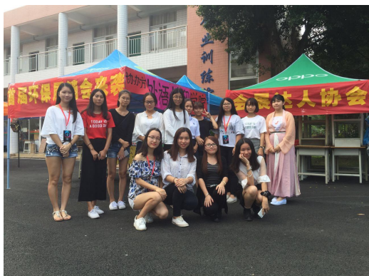
2016 会展协会成功组织城建首届环保展销会