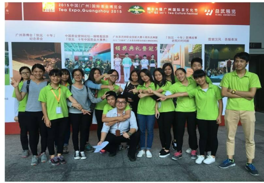
2015 广州国际茶博会顶岗实习