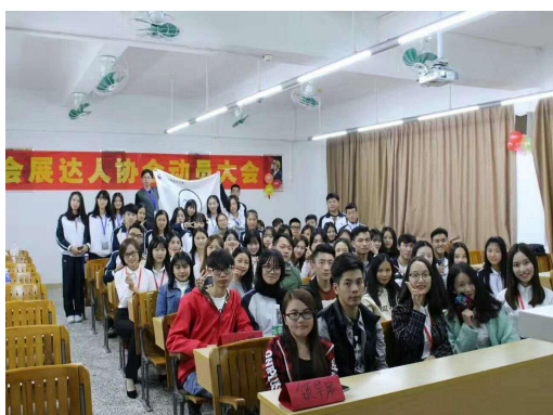
2016 会展达人协会动员大会