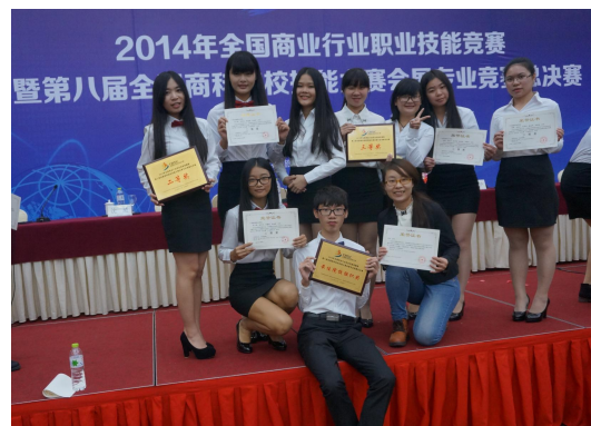
学生在会展专业技能大赛中喜获佳绩