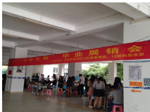
2014 “后会无期”毕业展销会