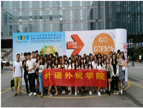
2016 广州琶洲展会参观学习