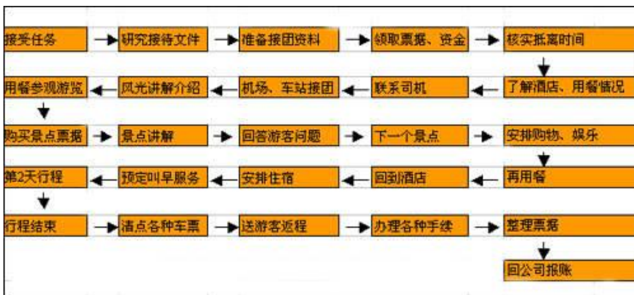
图一：导游工作过程流程图