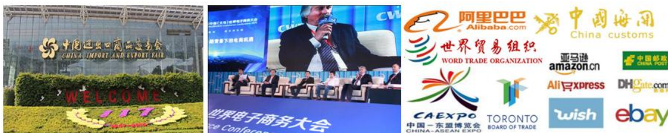
图 5 专业就业前景

本专业是珠三角重点优先发展的高端现代服务业之一。专业人才需求旺盛，发展前景宽阔，工作稳定体面，待遇高，毕业后可到政府涉外经济管理机构、跨国公司、外贸企业、跨境电商、海关、银行、外运企业等从事外贸业务员、跨境电商师、外贸跟单员、外贸单证员、报关报检、国际货代等相关工作，也可自主创业。外贸经理/跨境电子商务师年薪 10 万以上。