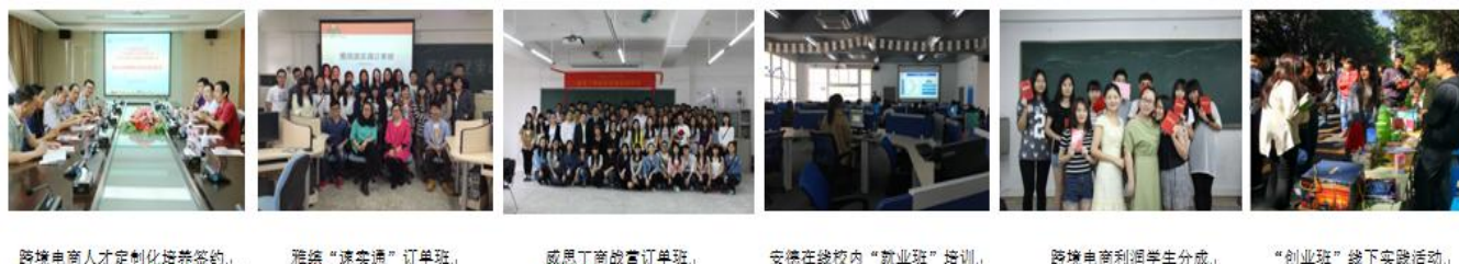
图 3 跨境电商领军人才订单班培养

本专业顺应“互联网+外贸”时代的到来，与时俱进，培养学生运用电子商务平台实现国际货物的跨国交易。把企业搬进校园，组建跨境电商领军人才订单班，企业资深经理人入驻学校培养准“员工”，学生在企业一线专家指导下在校内即可完成外贸真实业务操作，产生实际利润分成；也可在本专业跨境电商综合实训中心完成顶岗和校内创新创业训练活动，组建创新创业团队。