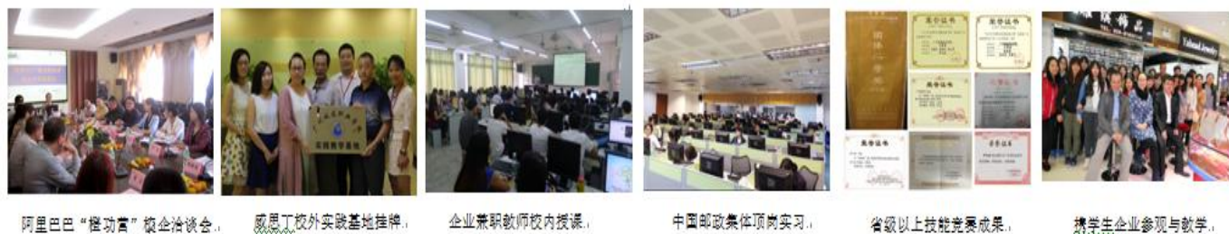
图 2 “课岗对接、理实一体”人才培养