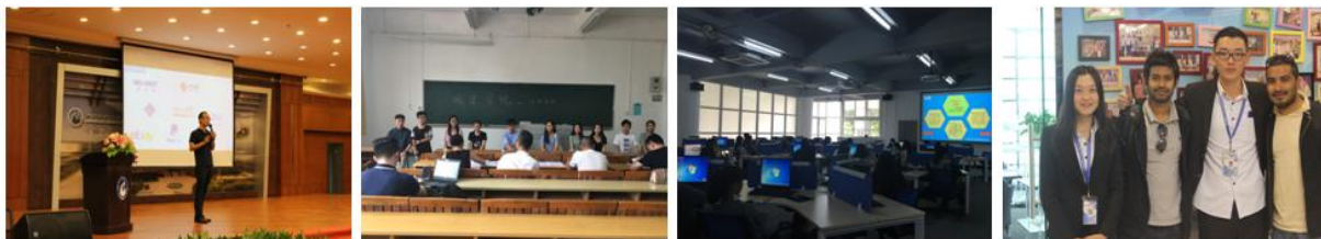
跨境电商企业创新创业大讲堂。